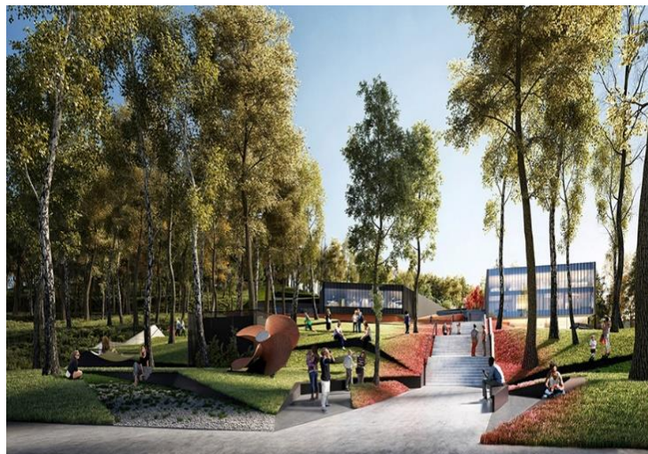
Innowacyjny kompleks informatyczny STOS PG