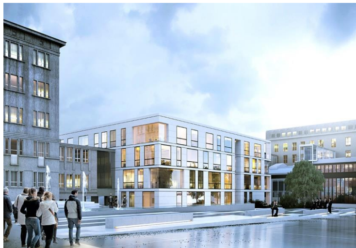
Centrum Ekoinnowacji PG